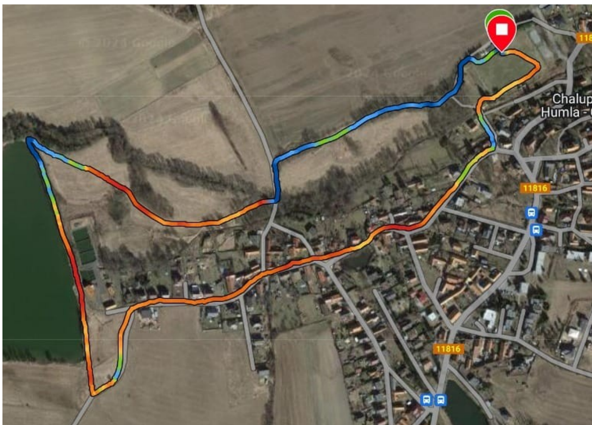
Trasa B (2 500 m)